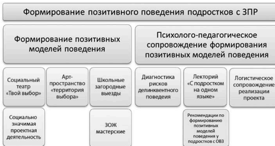
Рис. 1. Формирование позитивных моделей поведения подростков с ЗПР

Реализация программы предполагает следующие виды предлагаемой активности подростков: Арт-пространство «Территория выбора», Социальный театр «Твой выбор», школьные загородные выезды, социально значимая проектная деятельность (рис. 1). Каждая из этих подпрограмм имеет свое место в логике реализации проекта: профилактика формирования паттернов нарушенного поведения — замещение асоциальных поведенческих актов моделями позитивного поведения — включение усвоенных поведенческих моделей в более сложные варианты социального функционирования подростка.