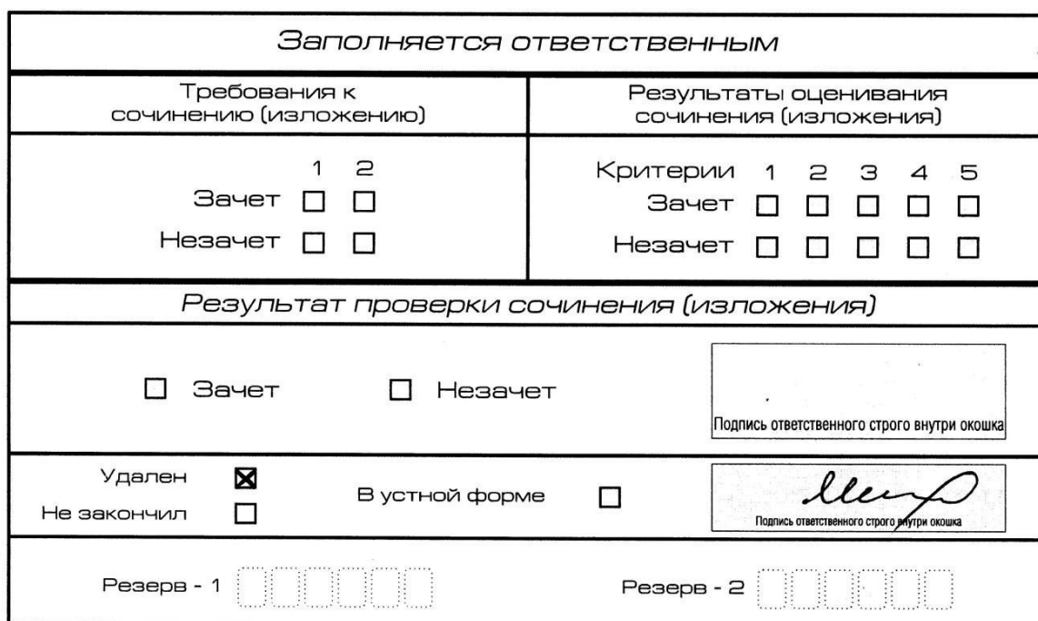
Рис. 11. Заполнение полей нижней части бланка регистрации (удаление с экзамена)

В случае если участник ИС(И) нарушил установленные требования, изложенные в пункте 28 Порядка проведения государственной итоговой аттестации по образовательным программам среднего общего образования (приказ Минпросвещения России и Рособрнадзора от 04.04.2023 № 232/551), он удаляется с ИС(И). Член комиссии по проведению ИС(И) составляет «Акт об удалении участника ИС(И)» (форма ИС-09), вносит соответствующую отметку в форму ИС-05 «Ведомость проведения ИС(И) в учебном кабинете ОО (месте проведения)» (участник ИС(И) должен поставить свою подпись в указанной форме). В бланке регистрации указанного участника ИС(И) необходимо внести отметку «X» в поле «Удален». Внесение отметки в поле «Удален» подтверждается подписью члена комиссии по проведению ИС(И) (см. рис. 11).