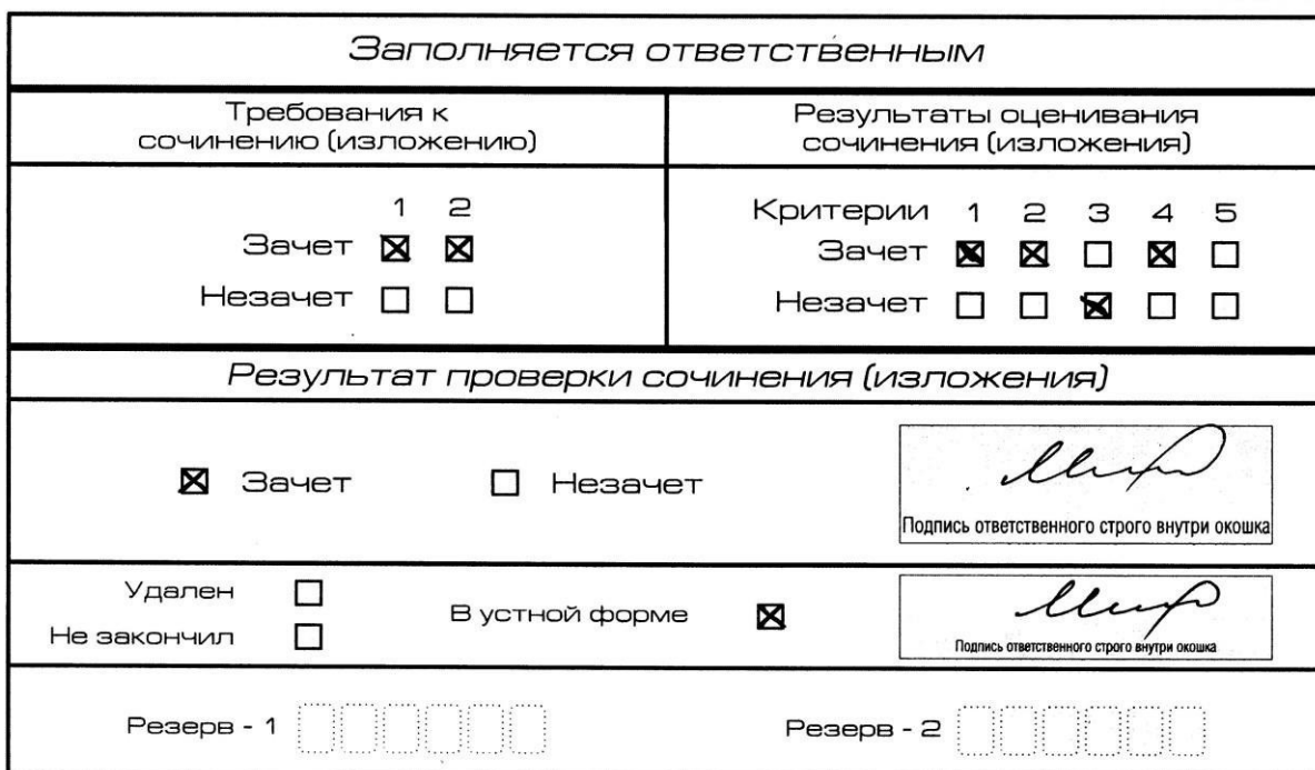
Рис. 9. Область для оценки работы сочинения (изложения) в устной форме

После окончания заполнения бланка регистрации ответственное лицо ставит свою подпись в специально отведенном для этого поле.