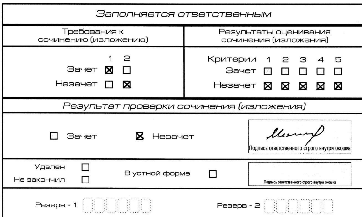
Рис. 7. Область для оценки работы

Если ИС(И) соответствует требованию № 1 и требованию № 2, то выставляется «зачет» за выполнение требования № 1 и требования № 2. Указанные сочинения (изложения) далее оцениваются по критериям.