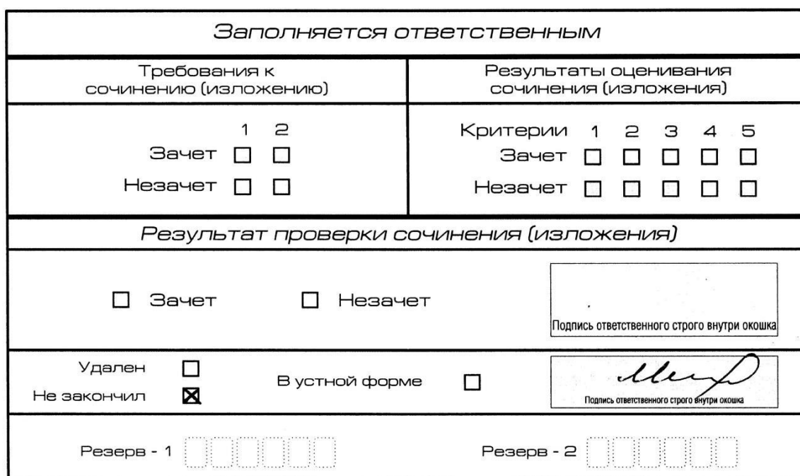
Рис. 10. Заполнение полей нижней части бланка регистрации (участник не закончил написание сочинения (изложения) по уважительным причинам)

В бланке регистрации указанного участника ИС(И) необходимо внести отметку «X» в поле «Не закончил» для учета при организации проверки, а также для последующего допуска указанных участников к повторной сдаче ИС(И) в дополнительные даты. Внесение отметки в поле «Не закончил» подтверждается подписью члена комиссии по проведению ИС(И) (см. рис. 10).